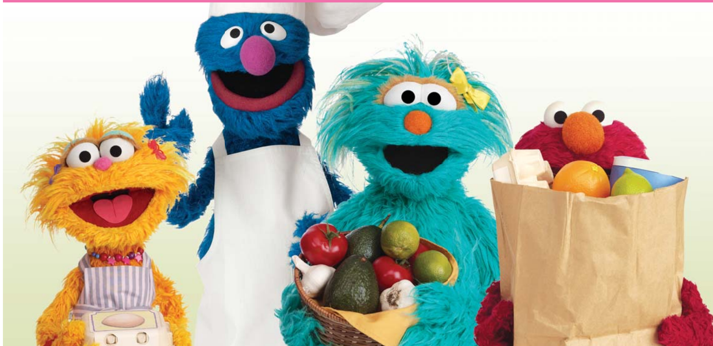
"Sesame Workshop", "Sesame Street"® y los personajes, marcas comerciales y elementos de diseño relacionados son propiedad, bajo licencia, de Sesame Workshop. © 2010 Sesame Workshop. Derechos reservados.